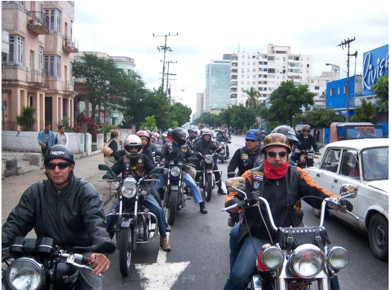
Integrantes del Capítulo LAMA Habana, Cuba 6 de enero del 2010.

Texto: Onelio García Pérez