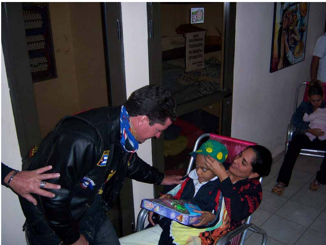
Motorista entregando un juguete.

Este frío miércoles 6 de enero del 2010 a la 1:45 p.m. una caravana de moteros salía desde la Peña “Amigos de Fangio” destino Instituto de Oncología del Vedado. Salieron por las calles 23, subieron por calle G hasta 29 y de ahí a la sala para entregar los juguetes a los niños el “ día de los Reyes Magos ” recordando a Melchor, Gaspar y Baltazar.