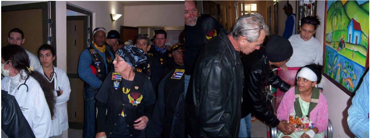
Llegada a la sala y entrega de juguetes.

Este frío miércoles 6 de enero del 2010 a la 1:45 p.m. una caravana de moteros salía desde la Peña “Amigos de Fangio” destino Instituto de Oncología del Vedado. Salieron por las calles 23, subieron por calle G hasta 29 y de ahí a la sala para entregar los juguetes a los niños el “ día de los Reyes Magos ” recordando a Melchor, Gaspar y Baltazar.