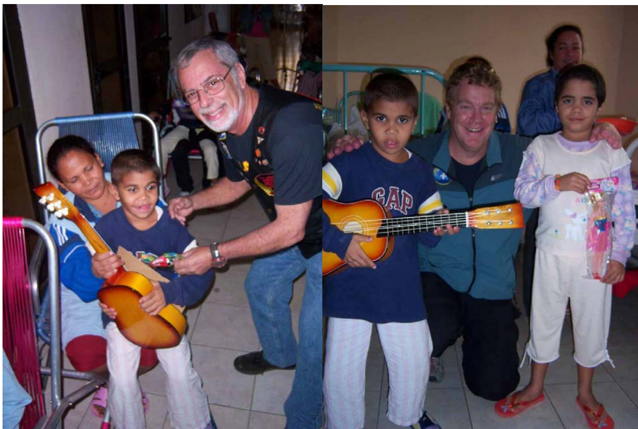
Motoristas entregando los juguetes.

La participación fue bastante numerosa, a pesar de que muchos de los motoristas habaneros se encuentran trabajando en sus respectivos centros laborales, lo que imposibilitó una participación masiva al hospital.